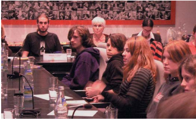
Tierschutzpolitische Runde - unsere Schüler sind engagiert dabei!

Denn an unserer Schule ist Natur- und Tierschutz Unterrichtsprinzip! Die Schüler lernen den Menschen, die Natur und die Tierwelt als Einheit zu sehen. Ihr Charakter wird dadurch positiv geformt und Achtung vor der Schöpfung entwickelt.