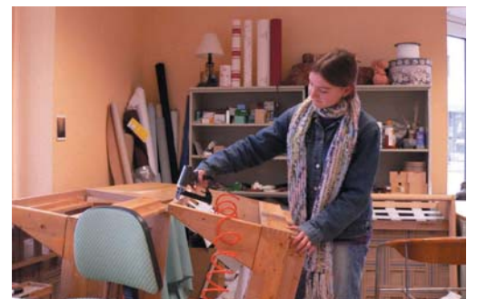
Berufspraktikum in einer Polsterei

blick und sammeln wertvolle Erfahrungen, die ihnen Hilfe bei der eigenen Berufsfindung sind. Die Praktika in den Lernwerkstätten werden unterrichtlich begleitet und ausgewertet. Die Schüler der Abgangsklassen nach dem Quali (9.Klasse) oder die des Mittleren Schulabschlusses nach der 10. Klasse konnten bisher alle eine Lehrstelle finden oder sind in weiterführende Schulen gewechselt