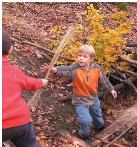
Spielen im Wald

nen im Wald und bauten Hütten aus Holz, Moos und Blättern. In "langen" Wanderungen ging es durch den sonnigen Spessart, entlang herrlicher Weinberge zur alten Burgruine "Clingen-