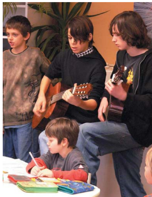
»Große« besuchen »Kleine«

Es fiel sehr schwer eine Klasse als Gewinner ausfindig zu machen, da sich viele sehr angestrengt hatten. So ent-