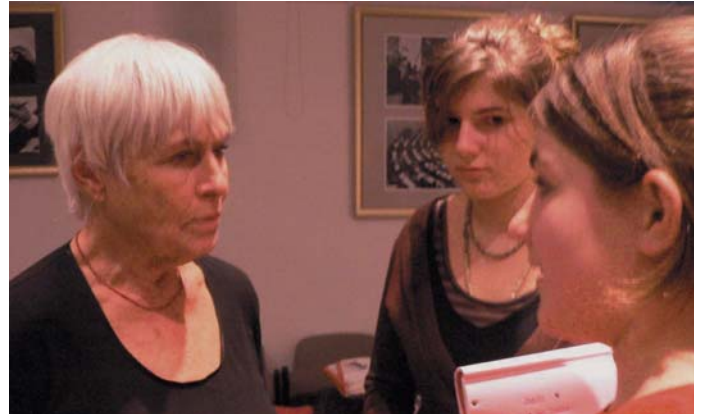
Im Gespräch mit Barbara Rütting, engagierte Tierschützerin und Alterspräsidentin des bayerischen Landtags