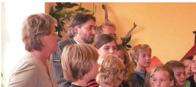
Die Begrüßung der »Neuen« vor der ganzen Schulfamilie