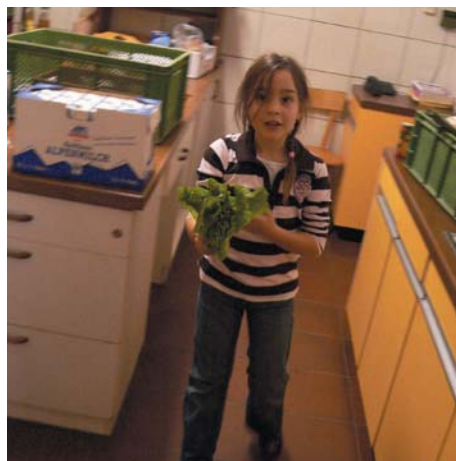
Küchendienst für die Gemeinschaft

Mitte November brach die zweite Klasse unserer Privatschule zu einem Schullandheimaufenthalt in die Nähe von Klingenberg auf. Die Kinder übernachteten dort mit Lehrer und Betreuerin zwei Nächte lang in einer kleinen Wanderhütte auf Matratzenlagern im Spessart. Stundenlang spielten die Klei-