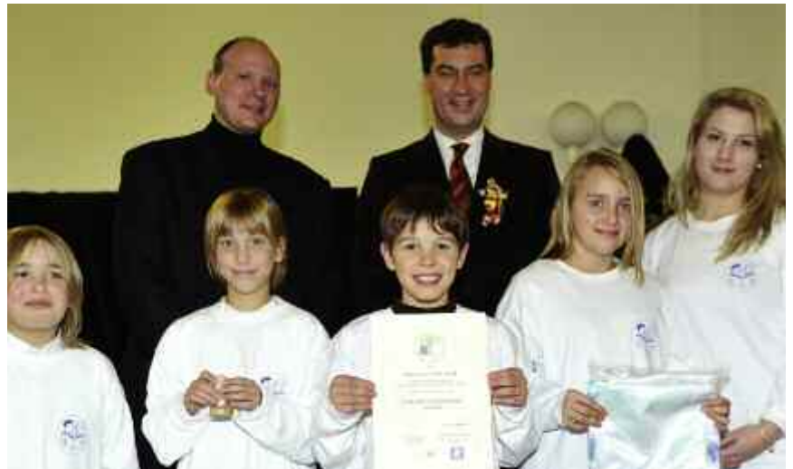
Staatminister Dr. Markus Söder zeichnete unsere Schule erneut aus

Staatminister Dr. Markus Söder zeichnete am 8. November 2010 in Nürnberg die Privatschule LERN MIT MIR im Universellen Leben als "Umweltschule in Europa / Internationale Agenda 21-Schule 2010" aus. Die Esselbacher Schule, die ihr Umweltengagement aus der Lehre des Jesus von Nazareth, des Christus Gottes ableitet, wurde bereits das vierte Jahr in Folge prämiert. Mit ihren Wettbewerbsbeiträgen zum Thema "Biodiversität" sowie zum Landesthema "Klimawandel und Klimaschutz" erreichte sie die höchste Kategorie mit drei Sternen.